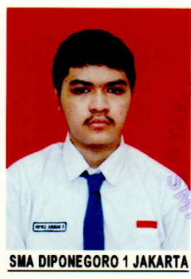
SMA DIPONEGORO 1 JAKARTA

Jakarta Timur, 12 Juli 2021 Kepala Sekolah